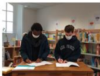
Bienvenue à DIDA!