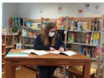
Bienvenue à Prisme!