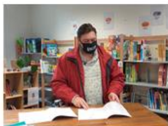
Bienvenue au Cadran!

Le 11 février dernier, c'est un moment de rencontres, d'échanges conviviaux et de perspectives de travail qui a réuni le Cadran, maison de quartier de Beauregard, Prisme, organisme de formation, D'ici ou d'ailleurs, association socio-culturelle, Rennes Métropole ainsi que l'équipe de la PEOL. Retour en images sur la signature qui a ponctué solennellement cette belle rencontre.